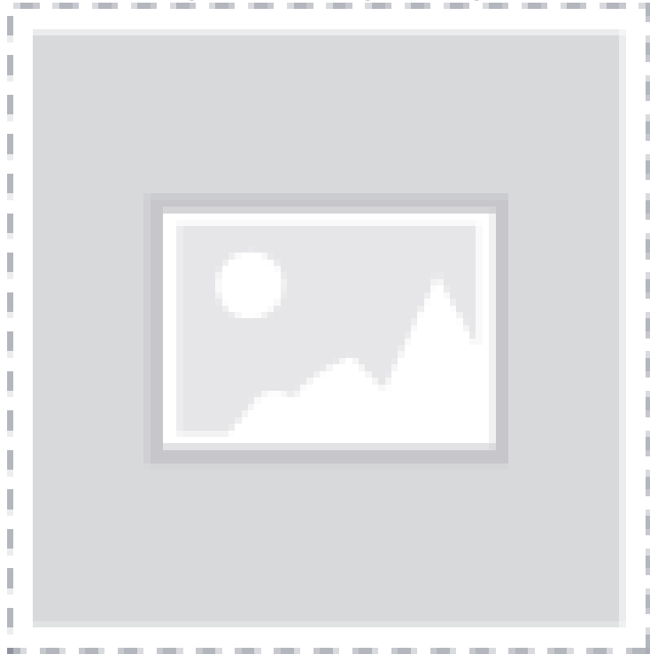
Table 1. Overview of grant-related consequences, in mio. kr.