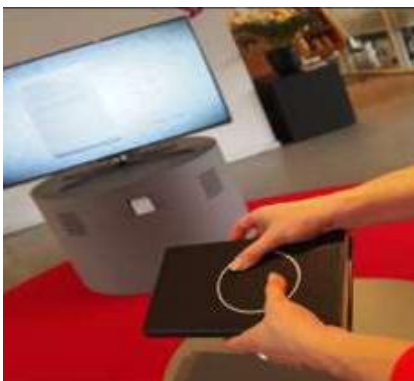
Poesimaskinen: Tilfældigvis er skærmen blevet blæk