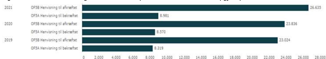
Figur 3. Antal bekræftede og afkræftede kræftpakkeforløb. 2019-2021. Opgjort pr. 27.01.2022.

Figur 3 nedenfor viser en opgørelse over antal bekræftede og afkræftede kræftpakkeforløb i 2019, 2020 og 2021. Figuren viser at antallet af bekræftede kræftpakkeforløb har været stigende fra 2019-2021. Antallet af afkræftede forløb er dog også steget i samme periode. Således er andelen af bekræftede kræfttilfælde lavere i 2021 (25 %), sammenlignet med 2020 (26,4 %) og 2019 (26,3 %). Ses der samlet for de tre år, er hitraten altså faldet i 2021 sammenlignet med 2019 og 2020.