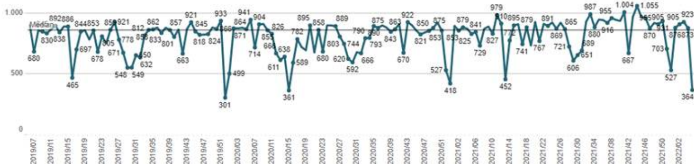
Figur 1. Antal henvisninger til kræftpakkeforløb – pr. 03.02.21. Uge 7 2020 – Uge 2 2021.

Note: Antal henvisninger er opgjort den 3. februar 2022. Antallet for de seneste to uger af opgørelsen forventes at stige på grund af efterregistreringer.