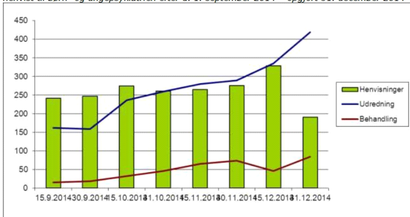
Antal ventende på udredning og behandling samt antal henvisninger i perioden, for patienter henvist til børne- og ungdomspsykiatrien efter d. 1. september 2014 - opgjort 31. december 2014

Kilde: MidtEPJ rapporten "Ventende patienter" dato for udtræk af data: 6.1.2015