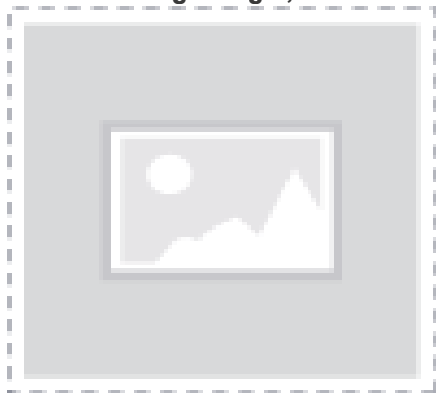
Tabel 1: Anlægsbudget, indeks 121 (i 1.000 kr.)

Med et budget for projektet på 14,2 mio. kr. for til- og ombygning af i alt 1.000 kvadratmeter bliver kvadratmeterprisen på 14.200 kr.